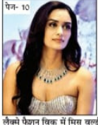
لکھنے پہچان تیک میں مینر ورنہ...